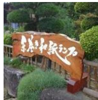
糸巻き和紙ランプの 看板が目印です