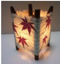
おし花雲竜和紙ランプ (四面紅葉)