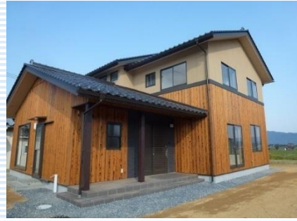
明るい色彩の焼杉と土色に見せた吹付で和風住宅に仕上がりました。