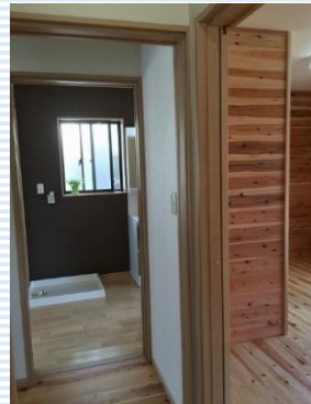
キッチン、衣裳部屋、洗面脱衣室へ最短動線で移動できます。