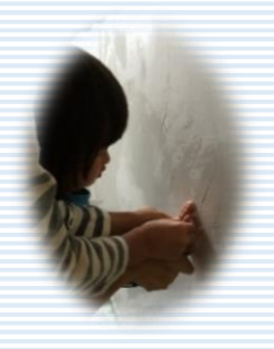
トイレの壁に家族みんなの手形を付けました☆