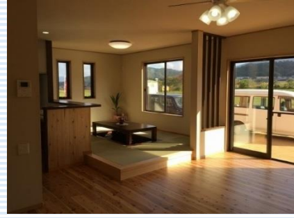
小上がりになったダイニングと素足にやさしい、杉板貼りのリビング。仲良し家族の憩いの空間☆