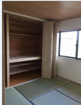
主寝室はたっぷり収納付きの、和室になりました。