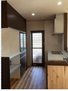
収納たっぷり! スッキリキッチン!