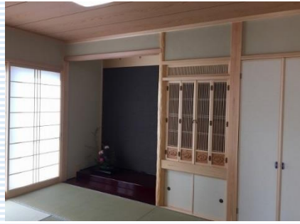
床の間の壁に貼った黒いクロスが印象的な、落ち着いた雰囲気のと室です。