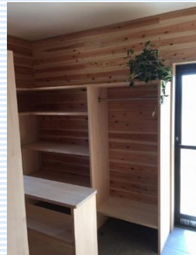
大容量のシューズクローゼットは、家族専用の玄関でもあります。

与謝野町の工務邸新築工事が無事完了し、引き渡しさせていただきました。土地探しから始まり、田舎に合った敷地を造成し、本体工事を行いました。共働きで若い夫婦に三人の小さなお子さん達。お施主様が願っておられた一階の衣裳部屋とシューズクローゼットを取り入れ、子育てと家事がしやすい間取りをプラスして使い勝手の良い家に仕上がりました。入居してからお子さんの喘息の発作が一度も起きないと嬉しい報告もいただき、家づくりをさせていただけた事にとても感謝しております。工務、おがみ工務店、ありがとうございました。